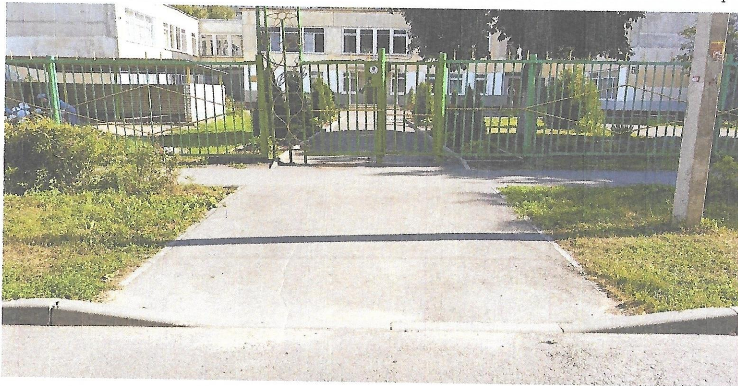
Подход к МБДОУ с улицы Пирогова