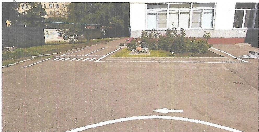
Фото на странице: 2